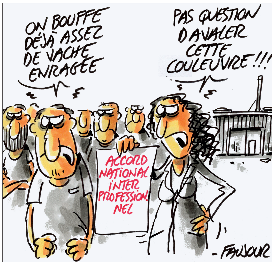
Bernard Thibault, secrétaire général de la CGT

Le 11 janvier 2013, les négociations nationales dites de «sécurisation de l'emploi» se sont terminées par un accord d'une extrême gravité pour les droits des salariés. La CGT et FO ont annoncé qu'elles ne le signeront pas. Par contre, la CFDT, la CGC et la CFTC ont décidé de le parapher. Un projet de loi doit être présenté au Conseil des ministres début mars, pour ensuite être voté au Parlement en mai.