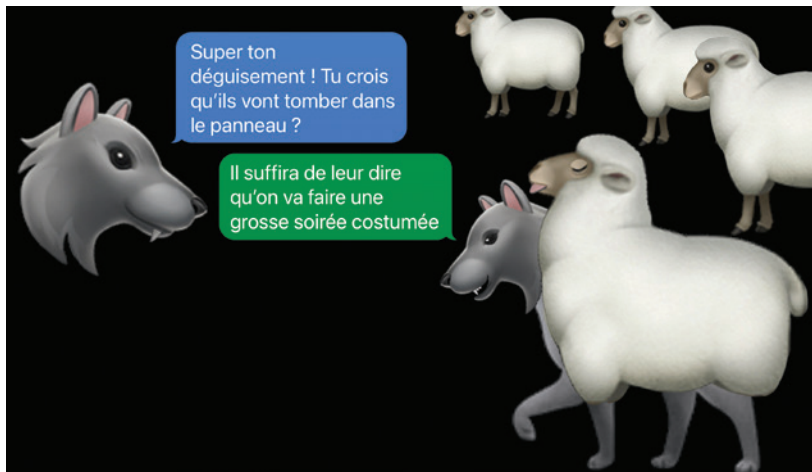
Dessin 100 % Cruetly Free.